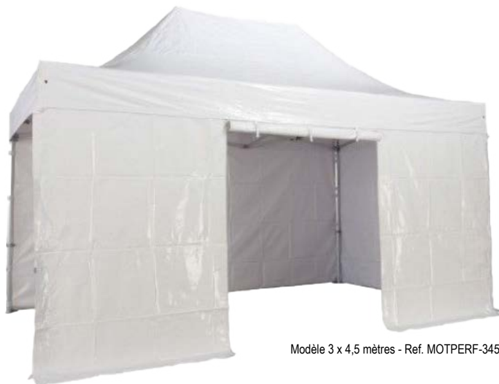
Modèle 3 x 4,5 mètres - Ref. MOTPERF-345