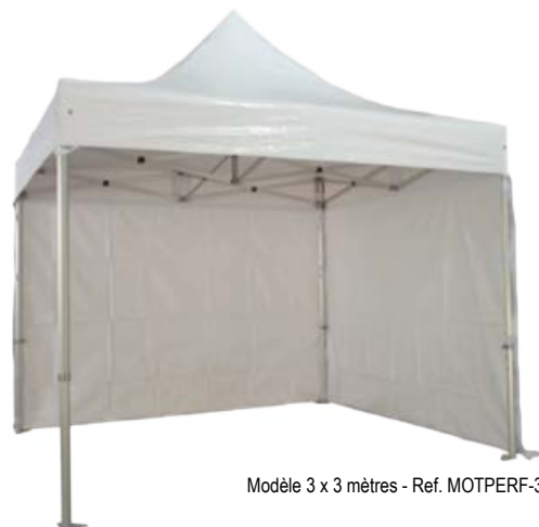
Modèle 3 x 3 mètres - Ref. MOTPERF-33